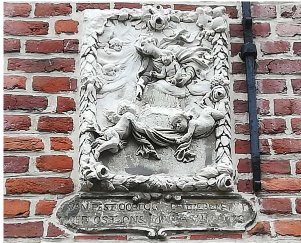
"Van pest en oorlog en dieren tijd, verlost ons Maria"