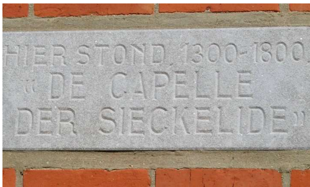
Ziekelingenstraat in 3000 Korbeek-Lo

Hier eindigt de fietstocht. Je kan langs de Kapucijnenvoer, de Minderbroedersstraat en de Parijsstraat nog tot aan het mausoleum voor pater Damiaan rijden op het pater Damiaanplein.