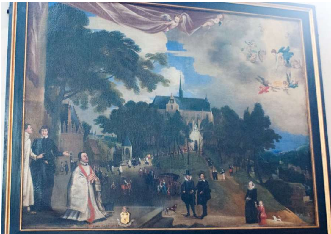
Pestprocessie vanuit de Sint-Kwintenskerk naar O L Vr van Bas-Wavre.