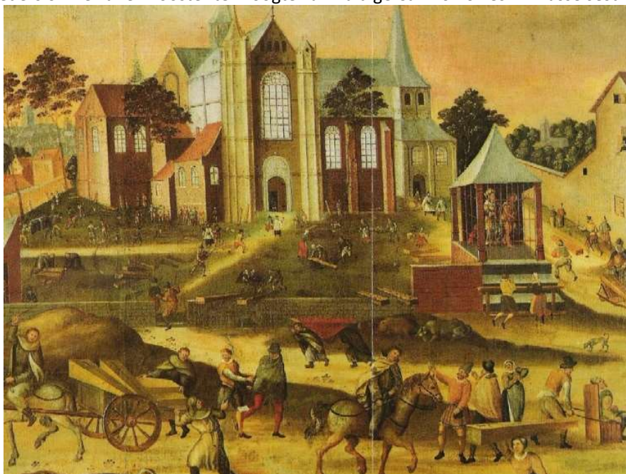
Cellebroeders begraven de doden nabij de Sint-Jacobskerk tijdens een pestepidemie in de 16 de eeuw..